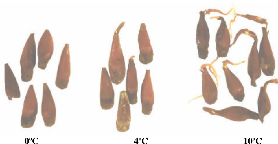
Foto 1: Estado de la semilla de Araucaria angustifolia tras 12 meses de conservación en envases EVA a distintas temperaturas

Contenido de almidón: el contenido inicial de almidón fue del 72,9%. A partir de los 2 meses de almacenamiento refrigerado se registró una disminución en todas las condiciones de ensayo; los menores valores (aprox. 40%) se hallaron en las semillas empaquetadas con la película EVA y almacenadas a 4 y 10°C. Al analizar los datos obtenidos en función del tiempo de almacenamiento, se observó que las diferencias halladas no fueron significativas ( P < 0.05 ) para las distintas películas, temperaturas empleadas y adición de aserrín.