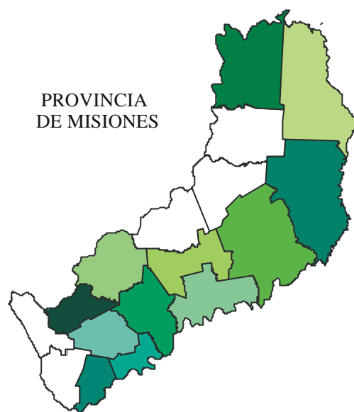
Mapa 1: Ubicación de los productores tabacaleros en los departamentos de la provincia de Misiones.

La propuesta técnica se basa en la promoción de especies forestales probadas y adaptadas a las zonas y al perfil de los productores.